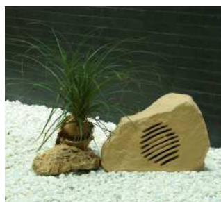
MR 110 S