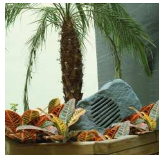
MR 110 G