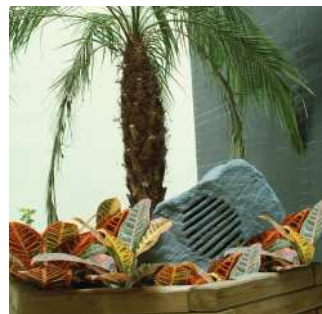
MR 110 G