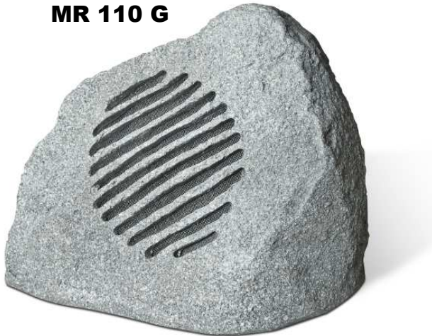
MR 110 G